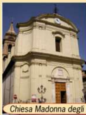
Chiesa Madonna degli Angeli