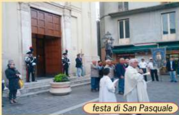
festa di San Pasquale