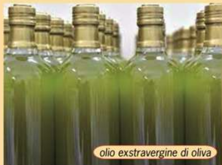
olio extravergine di oliva