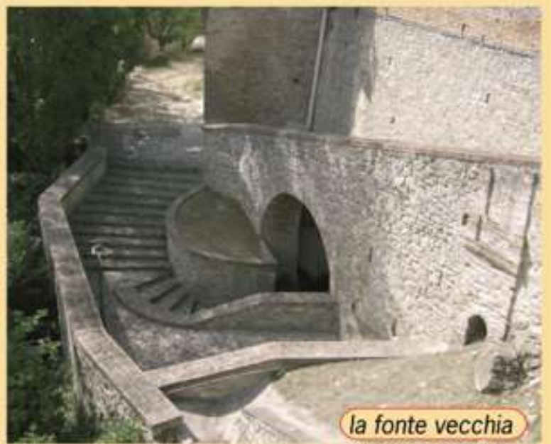
la fonte vecchia