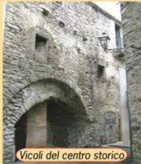
Vicoli del centro storico