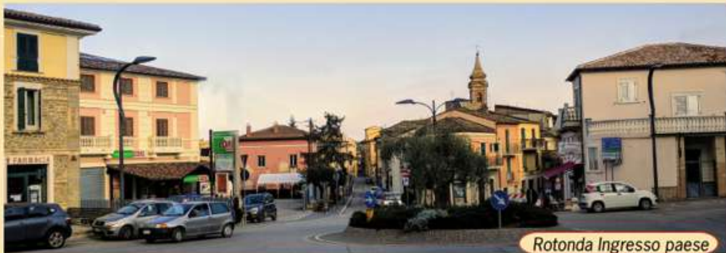
Rotonda Ingresso paese