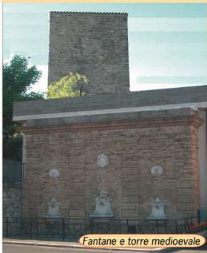
Fantane e torre medioevale