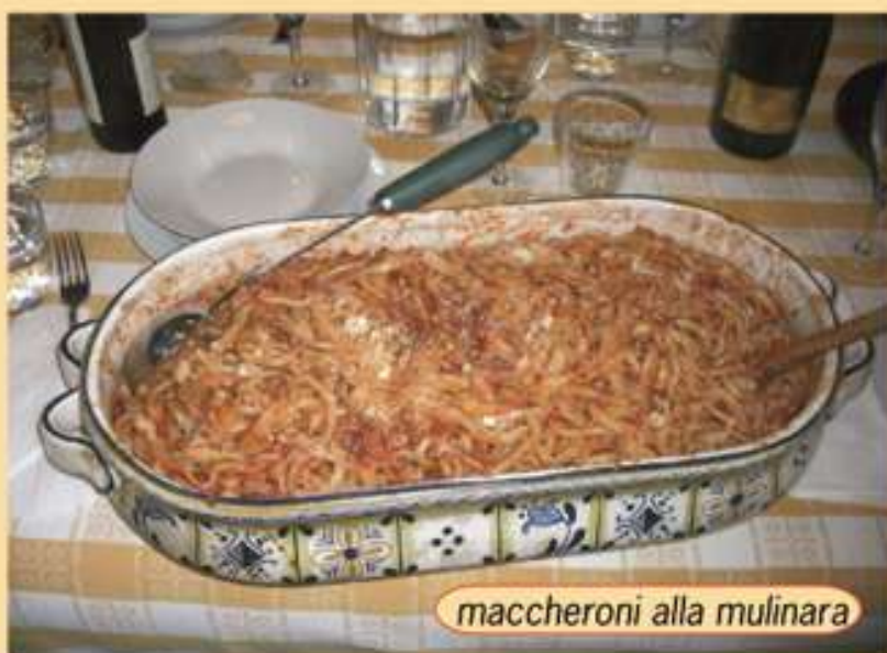
maccheroni alla mulinara