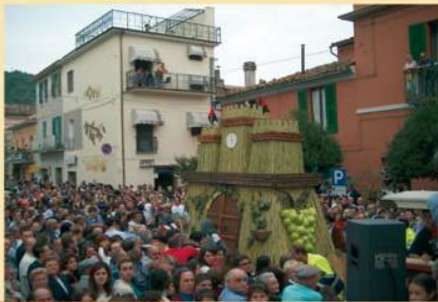
Festival Vino Montonico