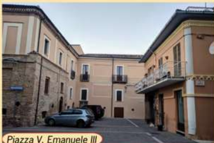
Piazza V. Emanuele III