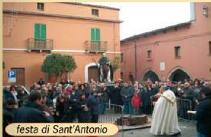
festa di Sant'Antonio