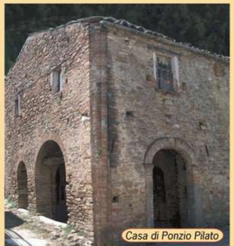
Casa di Ponzio Pilato